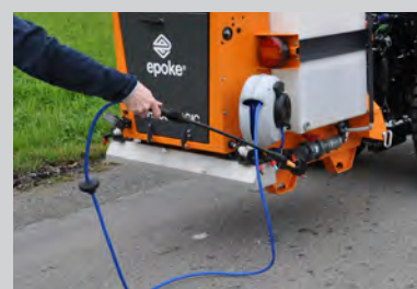
Ручной пистолет для ступеней и труднодоступных мест (опция).