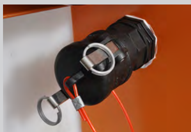
Коннектор шланга для полива (опция).