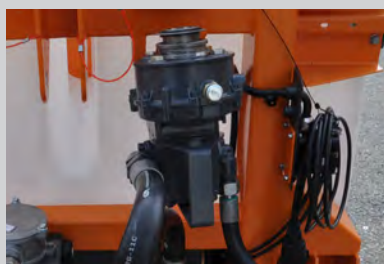
ВОМ с гидравлическим насосом установленным на распределителе.